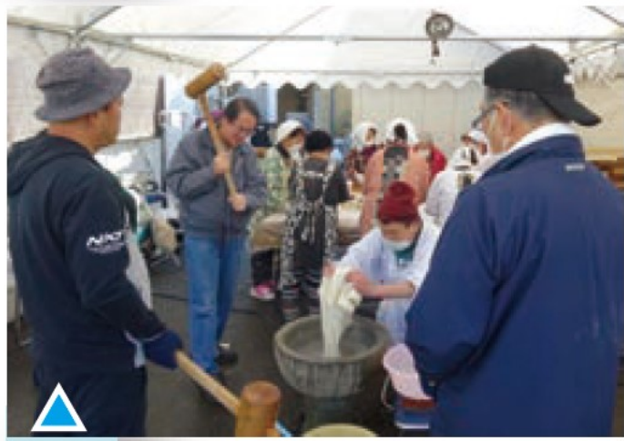
真備町へ餅お届け