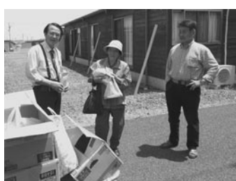
南相馬市の仮設住宅で5月

被災地支援は、今年正月、福島県南相馬市の仮設住宅へ柵つき餅を送った。五月には、第二七回の仮設住宅訪問を実施。被災者にお米などをお届けし、自治会長さんに現地の案内をいただいて、被災者と交流した。